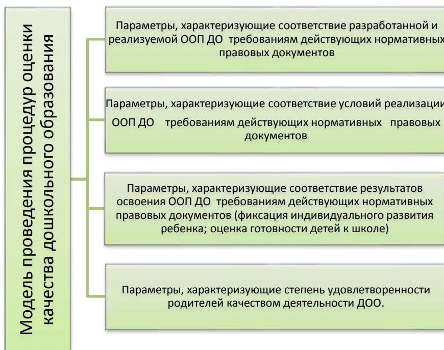
Схема 2. Модель проведения процедур оценки качества дошкольного образования 2 .